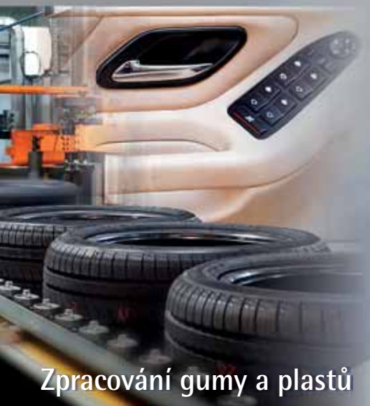
Zpracování gumy a plastů